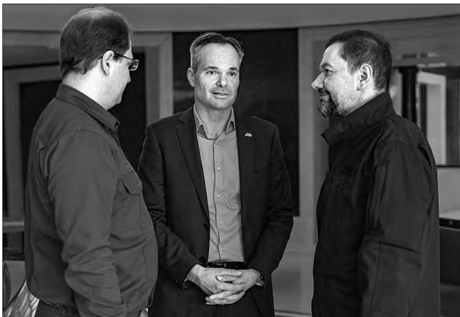
Очільник Міністерства захисту довкілля та природних ресурсів України Руслан Стрілець, міністр з питань довкілля та клімату Фінляндії Кай Мюккянен та голова Комітету Верховної Ради України з питань екологічної політики та природокористування Олег Бондаренко (зліва направо).

— Вдячні іноземним партнерам за готовність підтримати Україну у впровадженні сучасної системи моніторингу довкілля, — прокоментував результат домовленостей із фінською стороною Олег Бондаренко. — Також з Каєм Мюккяненем обговорювали такі важливі для України пи-