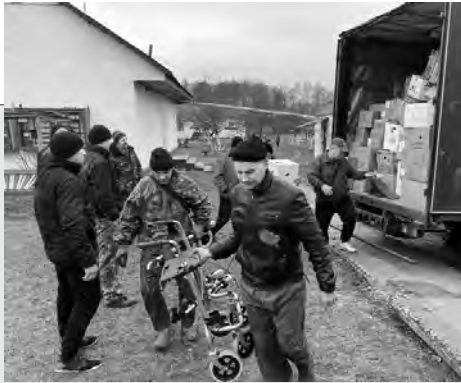
Депутат в окрузі