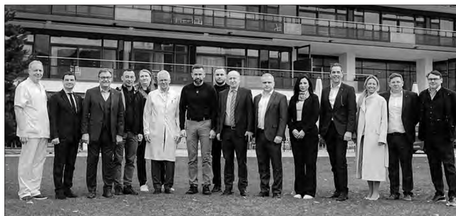
Делегація Закарпаття з фахівцями медичного реабілітаційного центру «Häring».